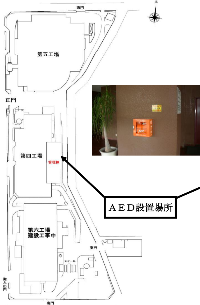
東大阪都市清掃施設組合配置図 工場配置図